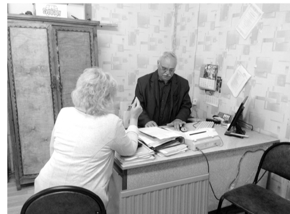
Отдел ЖКХ администрации МР «Бабынинский район».